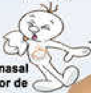
Flujo nasal y dolor de garganta