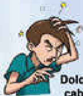
Dolor de cabeza intenso