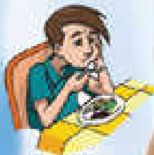
Perdida del apetito