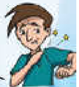
Dolor de las articulaciones